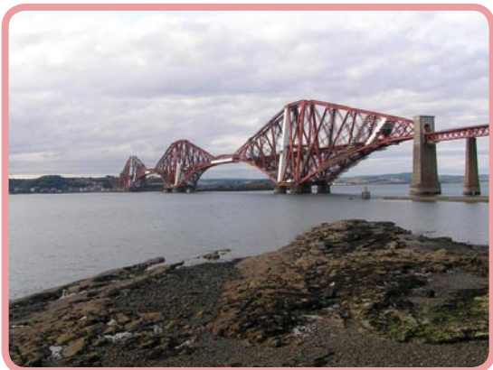
Vele bruggen worden tijdens de internationaliseringsweken geslagen

Internationalisering van het onderwijs is één van de speerpunten van de Hanzehogeschool Groningen. Het grenzenloze Europa stelt bijzondere eisen aan de mensen die we opleiden. Daarom zijn ervaringen met culturele diversiteit en het inzicht in internationale aspecten van de verpleegkundige beroepsuitoefening onmisbaar in het curriculum van onze opleiding. Deze aspecten spelen dan ook een belangrijke, stimulerende rol binnen onze Academie voor Verpleegkunde. We laten dit onder andere in de IP-weken tot uiting komen.