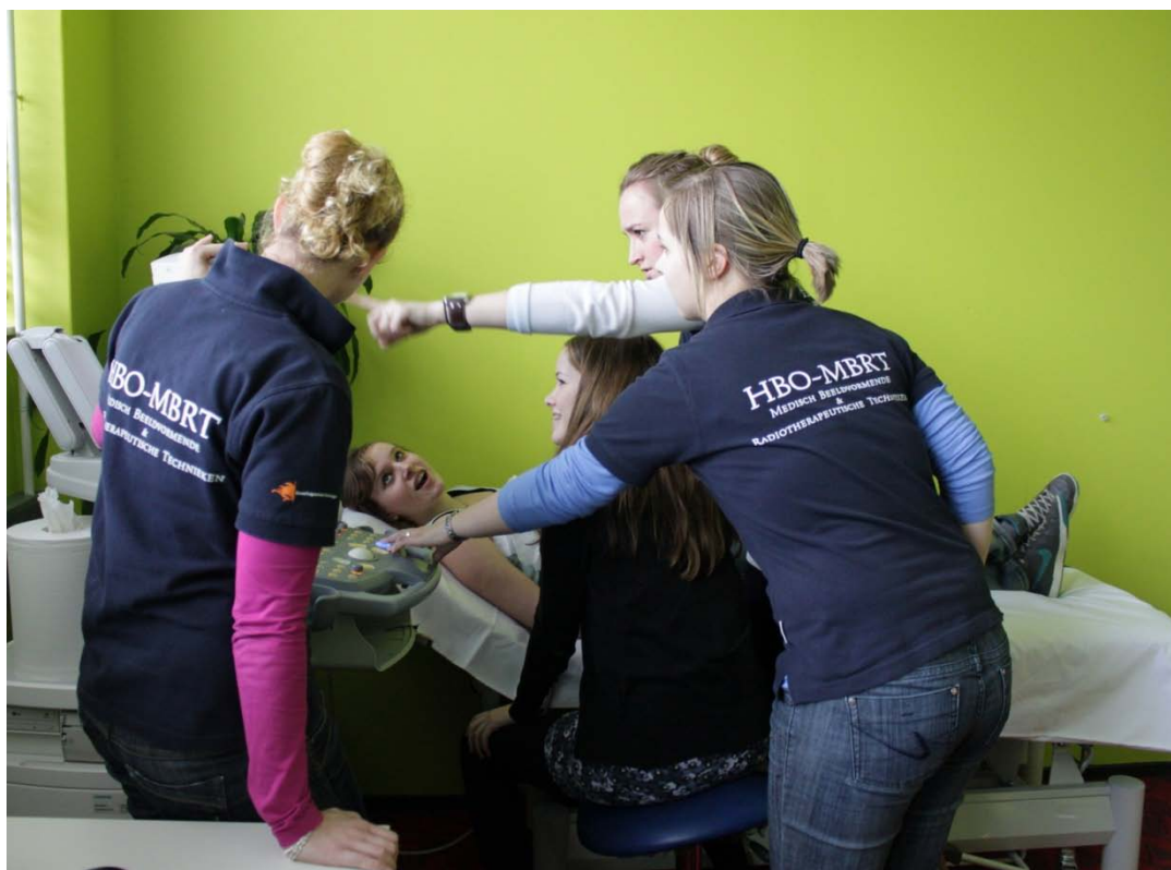
Bij MBRT konden de scholieren zelf een echo maken.

Uit de reacties van de deelnemers blijkt dat HanzeXperience een eerste kennismaking is met het hbo-onderwijs. Voor scholieren, die meestal pas het volgend jaar examen doen, is dit alvast een opstap naar een verdere oriëntatie op hun vervolgopleiding.