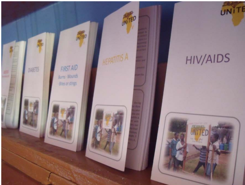
De voorlichtingsfolders die door de minorstudenten voor UNiTED zijn gemaakt.