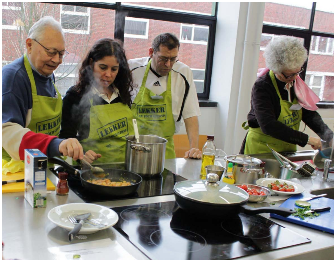
Deelnemers van alle leeftijden deden mee.