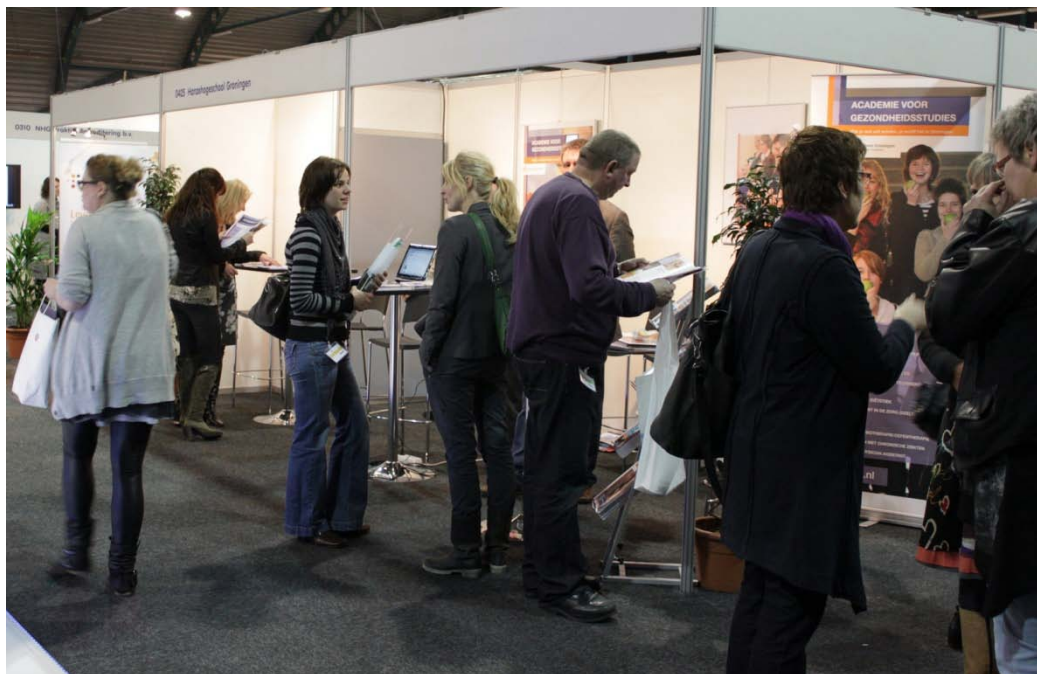
De stand van de Academie voor Gezondheidsstudies tijdens de Noordelijke Eerstelijnsdag.