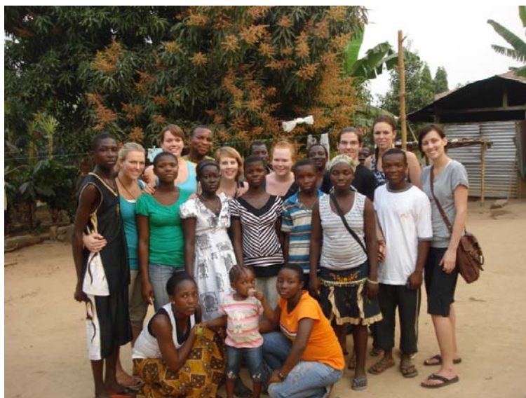
De Nederlandse minorstudenten samen met de leden van de dramaclub en enkele andere medewerkers.