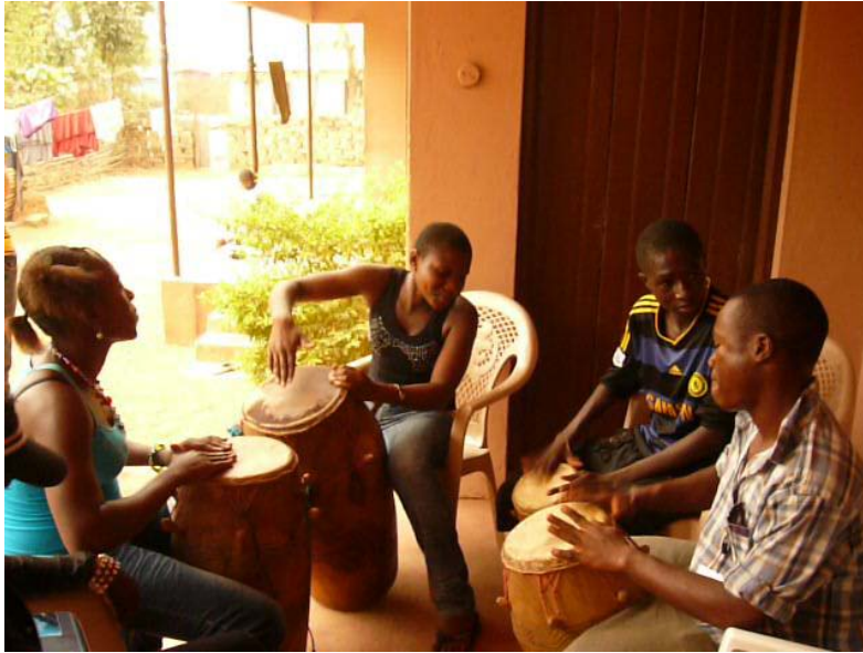
Een aantal leden van de dramaclub in Ghana.