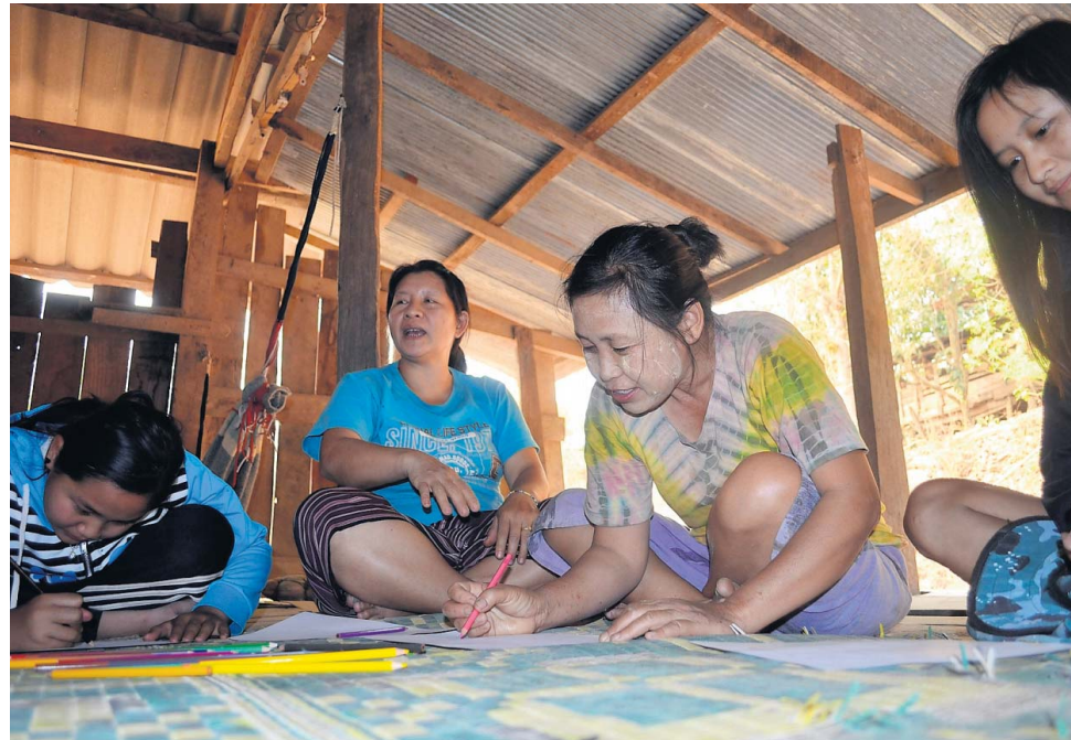
Thaise weefvrouwen geven aan hoe hun weverij eruit moet komen te zien.

kladblokken vol schetsen en onderzoeksresultaten sloten Epping en Van Nierop zich de afgelopen maanden met z’n tweeën op. Vorige week ronden ze hun studie af. Door de examencommissie werden ze aan-