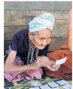
De 89-jarige La geeft met kaartjes aan wat haar wensen zijn: weven, buffels en een dokter.

De lector draaide vorig jaar samen met de Stichting Buffelen een proefproject en raakte enthousiast. „Als technet ben je vaak oplossingsgericht bezig, maar nu leren ze tijd te nemen om te onderzoeken wat er echt nodig is. Ze moeten ook hun handen uit de mouwen steken en vergeet niet de extra ontwikkelingsmogelijkheden op deze leeftijd, want ze leren communiceren zonder taal.”