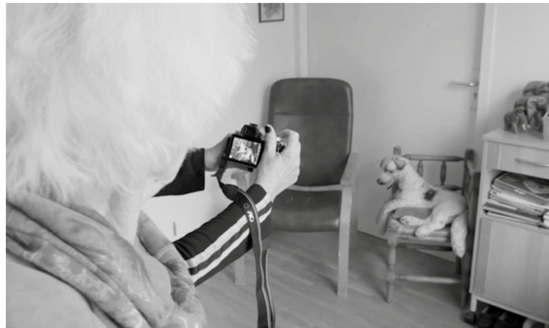
“Kijk, zo is hij ver weg en zo is hij dichtbij.” (15 min. 59’)

Na mijn studie ben ik met dit project 'Kijk, dit zie ik' gestart. Als artistiek onderzoeker van het lectoraat Image in Context heb ik een manier van werken ontwikkeld, een methode, waarmee iedereen in gesprek kan gaan met mensen met dementie via het maken van en spreken over foto's. Het is een ongebruikelijke vorm van ontmoeten. Uitgaande van gelijkwaardigheid wordt contact gelegd in het hier-en-nu. Alleen dan kan een relatie buitenstaander nog met een persoon met dementie communiceren. Via een artistieke-participatieve methode maken we kennis met de wijze waarop hij of zij de wereld ziet. De foto's in combinatie met de verhalen vormen de basis van deze aanpak. Door mensen met dementie tijdens het fotograferen te begeleiden in hoe een foto gemaakt kan worden, wordt het ook een artistiek product.