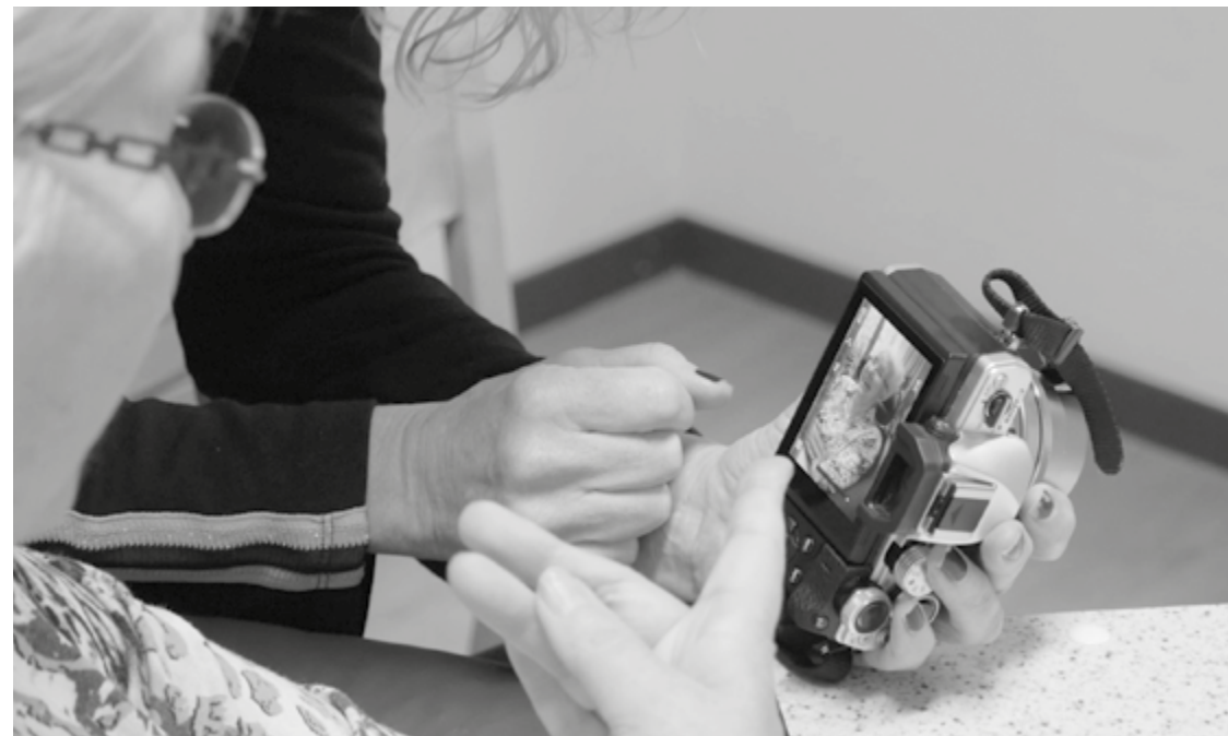
"Goed, dan gaan we die straks afdrucken. Dan krijgt u die van mij." (2 min. 16')

De makers waren over het algemeen oprecht blij met de afgedrukte foto's. Ze hadden ze natuurlijk ook zelf gecomponeerd. De afbeeldingen werden vaak bestudeerd, alsof de foto's een extra waarde toevoegden aan het onderwerp. Alsof het nu echt bestond. De portretfoto's konden ook op veel belangstelling rekenen. Als laatste stap werden de afdrucken tijdens de fotowandeling getoond aan andere bewoners . De medewerkers namen hierbij vaak een actieve rol in. Ze toonden interesse en gaven veel complimenten. Zij stimuleerden ook dat de bewoner ze aan de anderen lieten zien. De foto's, van wat mooi of interessant was, hadden toelichting van de bewoner nodig, en dat zorgde voor interactie. Er werd nooit gevraagd waarom iets was gefotografeerd. Het ging altijd over wat je zag op de foto. De onderwerpen waren herkenbaar en misschien werd het daardoor interessant gevonden. De portretfoto's zorgden ook voor veel reacties. Omdat het 'mooie' foto's waren, kreeg de maker hierop direct positieve en vaak vrolijke feedback. En dat versterkte opnieuw hun gevoel van eigenwaarde.