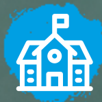
4 Jaar PABO

Je kunt een hbo-opleiding doen als je een havo diploma of een mbo4 diploma hebt.